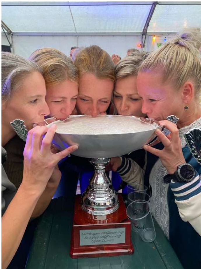
Batavieren dames open kampioensteam met de welverdiende wisselbeker!