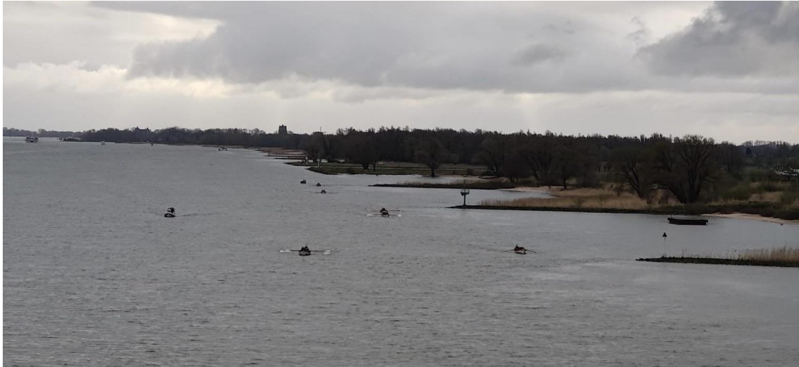
Het rondje Altena start op de Afgedamde Maas voor de haven van WV Woudrichem. Via de Boven Merwede, de Nieuwe Merwede naar de Biesboschsluis in Werkendam.