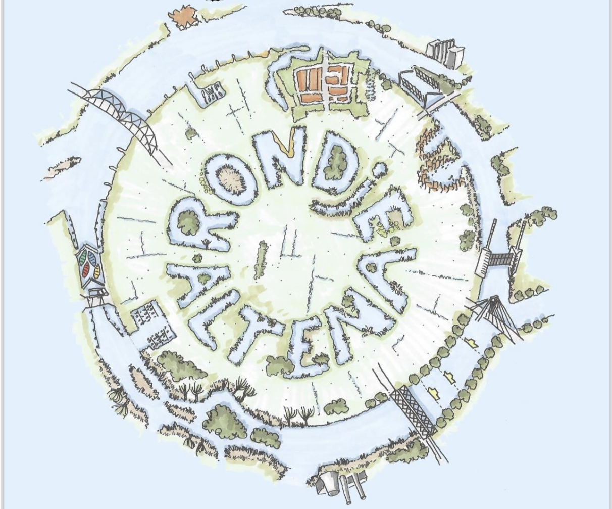
RONDJE ALTENA 16 maart 2024