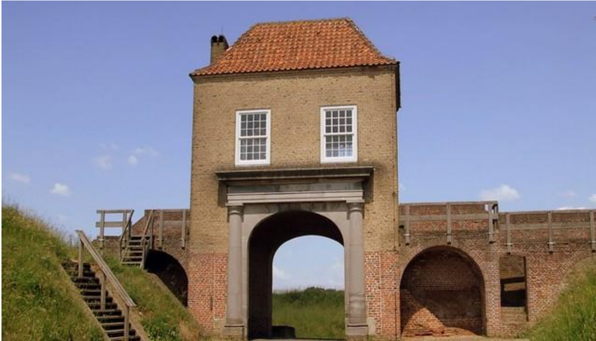
De Waterpoort van Heusden