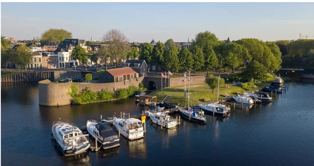
Op het kruispunt van de AA, de Dieze en de Dommel ligt de fraaie stadshaven van 's-Hertogenbosch, met de WSV de Waterpoort